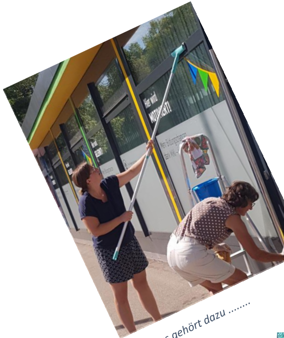
Auch das gehört dazu .....