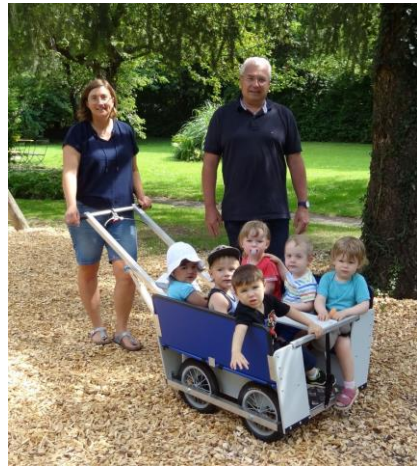
Wir werden mit Hilfe von Rotary mobiler