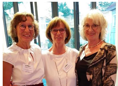
Erhielten für ihren unermüdlichen Einsatz die Ehrenamtskarte