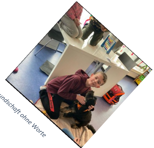
Freundschaft ohne Worte