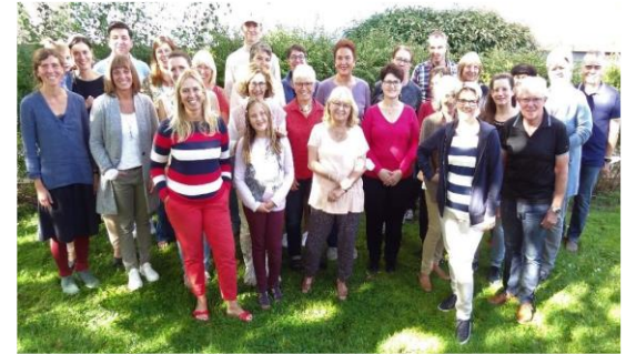
Unser tatkräftiges Team - seit 4' Jahren in Kempten aktiv